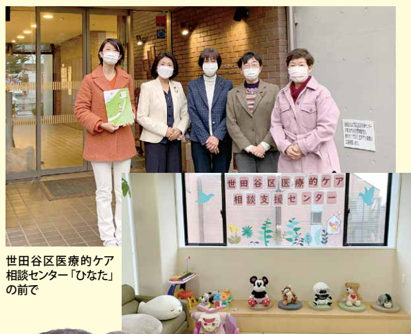
世田谷区医療的ケア相談センター「ひなた」の前で

世田谷区では、医療的ケア相談センターを設置し、さまざまな相談への対応を行うとともに、在宅生活を支える計画や災害時個別の支援計画などの作成も行っています。今後は、保育園や学校へ通うお子さんを支援するためにも保健、医療、福祉、教育等の連携を一層推進していく必要があります。